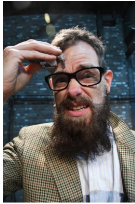
De secretaris van de Schrijversbond