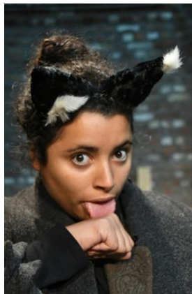
Behemoth, een zwarte kat