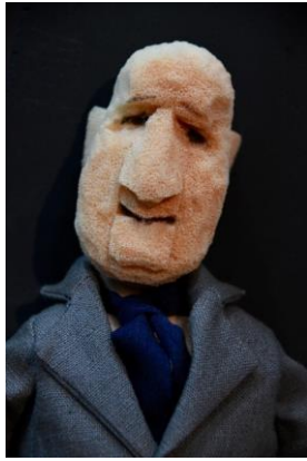
De secretaris van de Schrijversbond