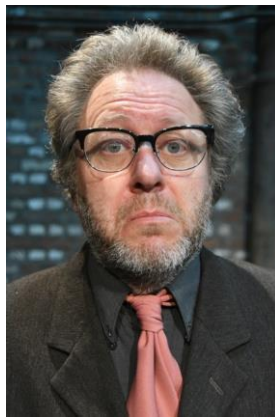
Latoenski, de opvolger van Berlioz als voorzitter van de Schrijversbond