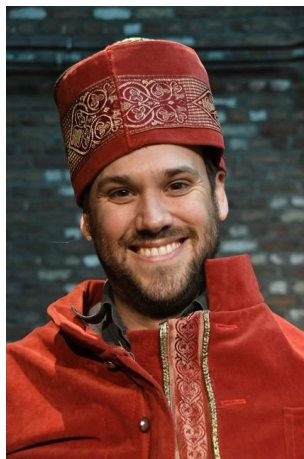
De presentator van Woland's theatershow