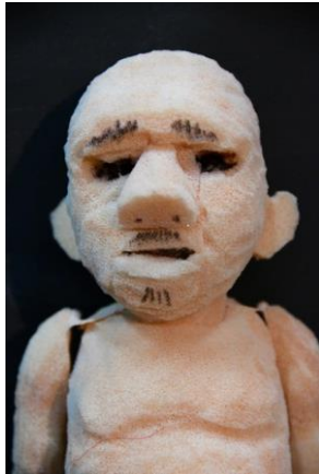
Pontius Pilatus, de man die toestemde in de kruisdood van Jesjoea