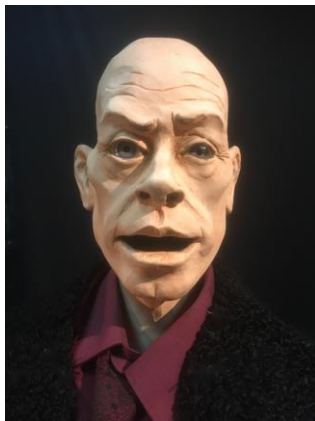
Woland, professor in zwarte magie