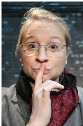
De penningmeester van de Schrijversbond